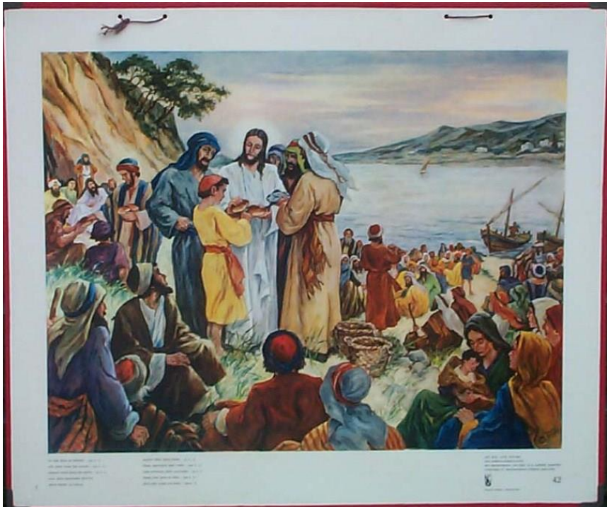
Afbeelding: een oude schoolplaat.

vierde zondag 40-dagentijd “zondag Laetare: verheug u”