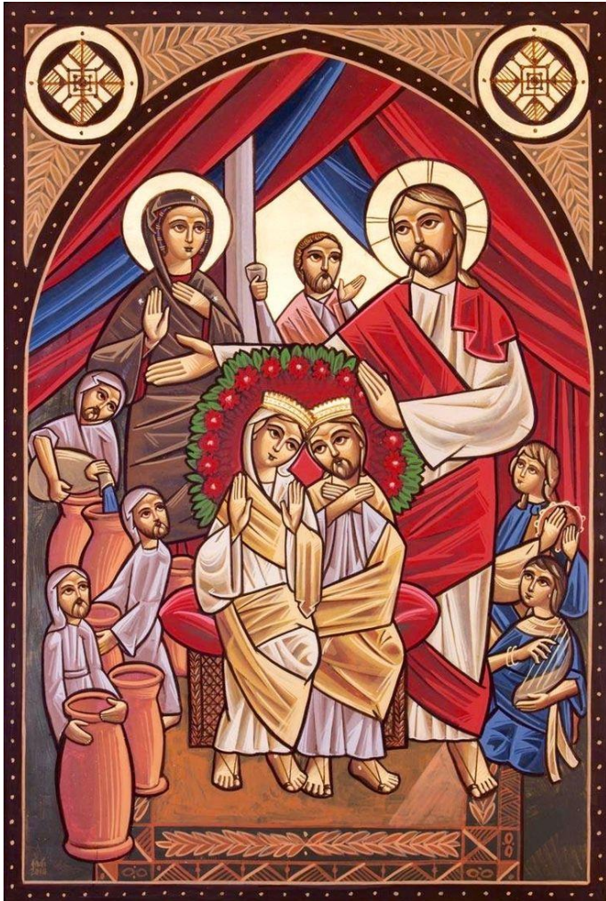
De bruiloft bij Kana – koptisch icoon

Welkom bij de viering in de Galluskerk op 14 januari 2024